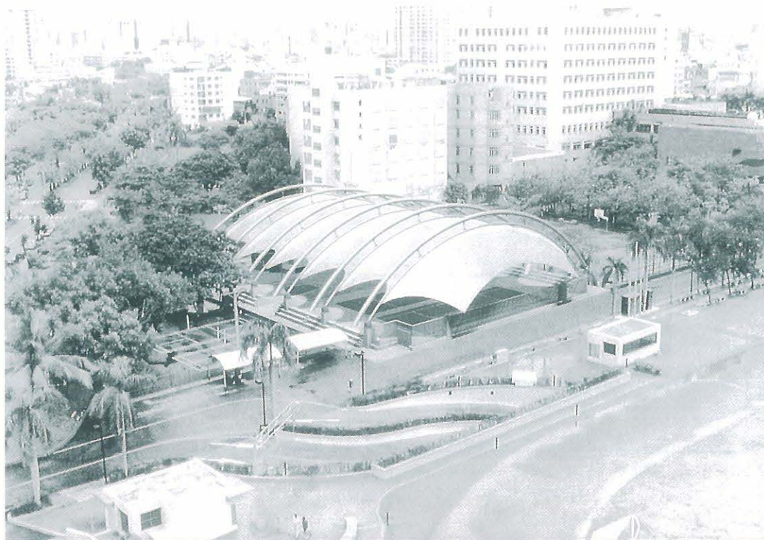
本工程新建會場已於六月十二日完工配合畢業典禮使用