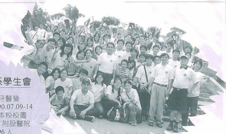
●師生敦親睦鄰實施社區勞動服務教育