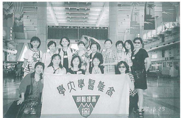
●● 親愛的院長機場送機並留影紀念可見院長對我們的關心。