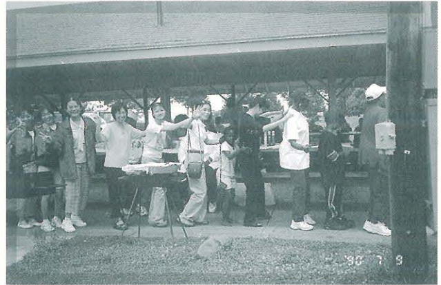
●● 一年一度教堂活動! 大家一同跳兔子舞!

滿載歡欣與喜悅、充盈的新知以及豐美的心靈感動，於 7 月 21 日我們返抵高雄。回想起短短的二十天中，幸運的我們擁有學校及護理學院全力的支持，研究生們也申請到校方的補助。在此情況下，有機會赴執護理界牛耳的美國，學習新知，瞭解新趨向，心底充滿幸福及感恩。此次學習之旅當會激發往後在護理專業上的更上層樓。衷心期待此類交流計劃能持續進行，讓本校師生能拓展視野，將本校放眼國際的理念，付諸實踐。