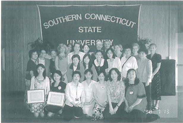
●● SCSU 舉辦歡送會他們很用心與會人員有副校長、學務長及多位教授