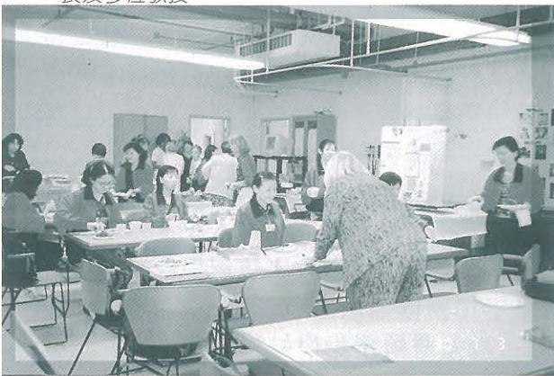
●● SCSU 教授授課關於「法律與倫理」。

遊。這些細心體貼的全人照顧，也讓我們不只在課堂，還在日常生活及藝文活動中，體會異國文化的關懷及內在精髓，而我們師生 13 人也回報以熱切的關心及認真的學習，在兩校師生間構築了很強的一道友誼鏈。