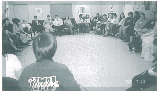
●● 晚上與「婦女健康」課程的學生舉辦座談會談論女人問題，大家相談甚歡。