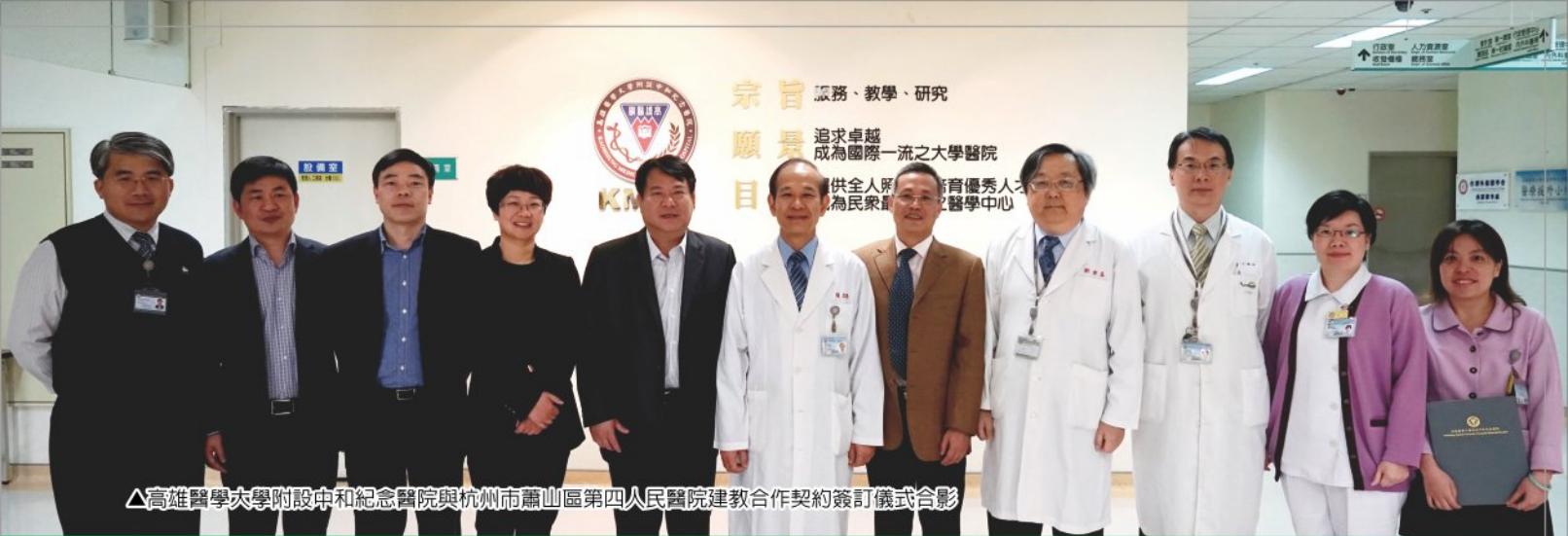
△高雄醫學大學附設中和紀念醫院與杭州市蕭山區第四人民醫院建教合作契約簽訂儀式合影