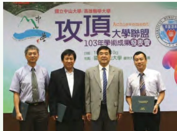
▲103年合作研究優秀獎（高雄醫學大學）