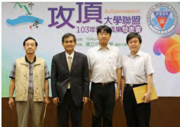
▲103年合作研究優秀獎（中山大學）

由於兩校經費之挹注，目前研究成果依據Web of Science資料庫分析兩校每年共同發表論文數，從2011年發表74篇，2014年發表增加至238篇，合作論文篇數逐年增加，顯示兩校合作成果豐碩。期望在兩校攜手合作下，共創南台灣之研究高峰，朝亞洲頂尖卓越大學邁進。