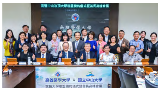
▲兩校首長及工作圈同仁合影

鄭校長則表示，二校合作共同創造美麗的新境界，以前學術界有北臺大南中山，醫學界則有北臺大南高醫之號稱。中山大學與高醫大藉著跨領域的結盟必然創造更亮麗的高等教育能量。📍