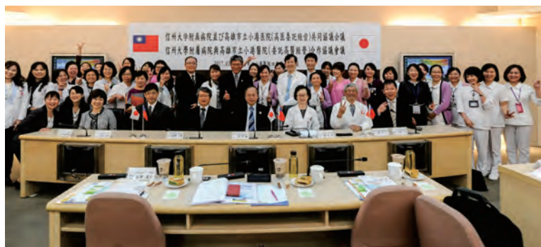
▲會後中日醫院人員合影

有鑑於此，兩院希冀於急重症醫療與照護等領域進行交流合作，以提升兩院的醫療服務水準；此次的簽署儀式，除為雙方的交流確立方向外，更開啓了小港醫院中日醫療合作的新願景。👏