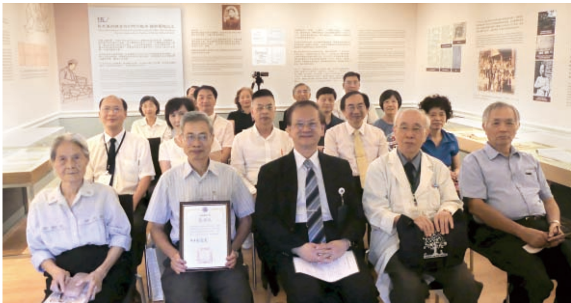
▲開幕典禮蒞臨貴賓合照

本館上檔特展「醫人治世的先覺者－白色恐怖時期醫生群像特展」，以重現臺灣醫師公共參與的入世精神為主，而臺灣醫師的公共參與，實際上可回溯至日治時期，如蔣渭水、賴和等醫師。其中，蔣渭水醫師的重要貢獻之一便是反對鴉片政策。因此，延續對醫事人員社會參與，以及醫療社會面向的關注，本館和蔣渭水基金會及秋惠文庫合作，以日本統治時代的鴉片為主題，舉辦「臺灣社會與總督府的阿片戰爭」特展。