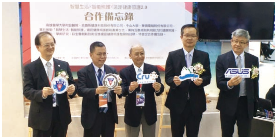
▲高醫體系參與臺灣醫療科技展