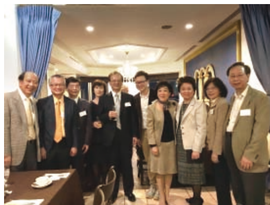
▲日本校友與劉校長夫婦合影