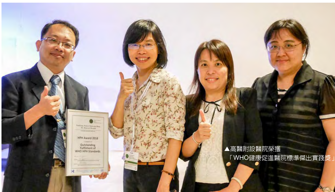
▲高醫附設醫院榮獲「WHO健康促進醫院標準傑出實踐獎」