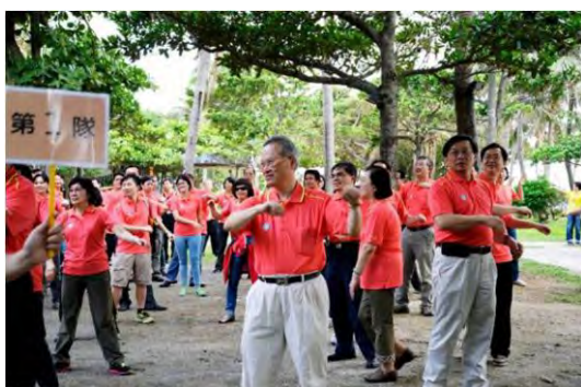
▲全院健康促進活動

高醫附設醫院榮獲「WHO健康促進醫院標準傑出實踐獎」，並於今年6月6日到6月8日於義大利波隆那國際會議中心舉辦的「第26屆健康促進醫院與服務國際研討會」(26th International Conference on Health Promoting Hospitals and Services)中接受頒獎。