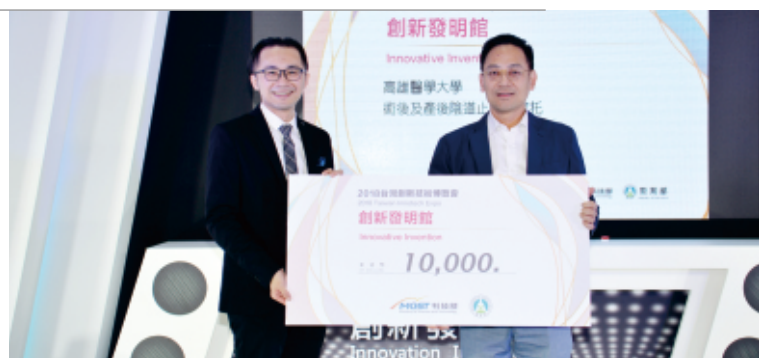
▲2018臺灣創新技術博覽會—創新發明館頒獎典禮

「術後及產後陰道止血子宮托」在未充氣的狀態時直徑約為1公分，外層設計成球囊，可供充氣調整大小，內層由硬度較高的塑膠組成，可方便置入患者體內，充氣後尺寸最大直徑可達5.0公分，外層球囊有螺紋設計可卡住在陰道中不易脫落。此子宮托藉由充氣改變囊體的大小，可依不同人提供最適當的尺寸，以達到最佳的子宮托功能，同時也可以對陰道壁形成較大的壓力，進而達到高壓止血的功效。 「術後及產後陰道止血